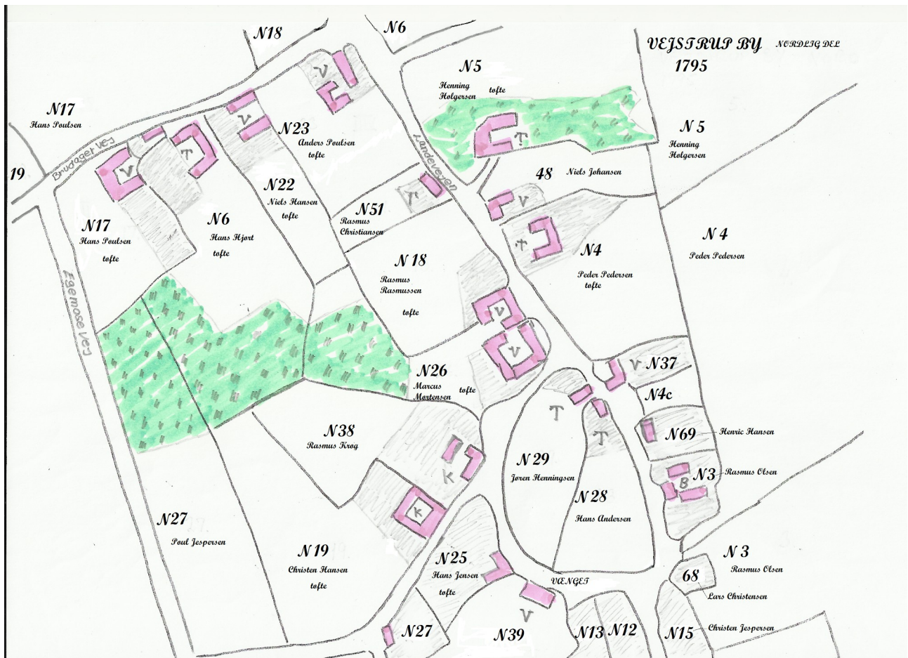
Den nordlige del af Vejstrup By ca. 1795 – før udflytningen.